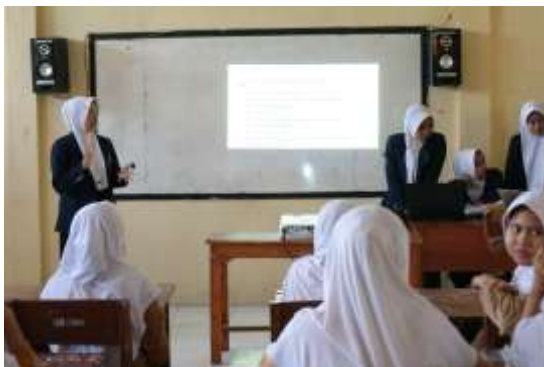
Gambar 1. Penyampaian materi seminar