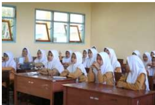
Gambar 2. Siswa mendengarkan materi

Terdapat sejumlah peserta yang merasakan dampak positif dari penelitian ini, peserta PowerPoint, tetapi juga dilengkapi dengan sesi praktik langsung yang membantu peserta untuk menerapkan ilmu secara nyata.