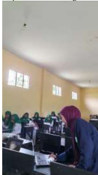
Gambar I penjelasan materi

tidak hanya mengembangkan keterampilan teknis, tetapi juga membentuk pemahaman terhadap narasi visual dan storytelling dalam konteks produksi media digital.