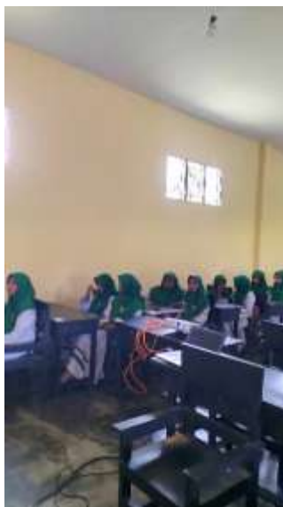
Gambar III menjelaskan materi.