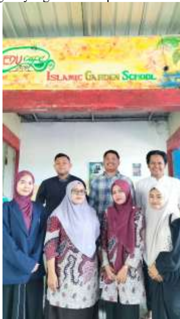
Gambar V Dokumentasi bersama guru SMK IGS Mumbulsari

Sebagai tindak lanjut, guru menyarankan agar sekolah meningkatkan infrastruktur pendukung berupa laboratorium multimedia yang memadai serta merancang program pelatihan lanjutan agar siswa dapat mengembangkan kemampuan ke tingkat yang lebih kompleks.