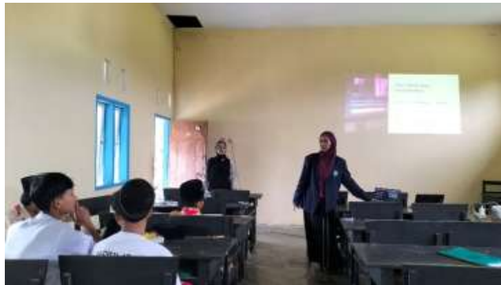
Gambar II menjelaskan materi.