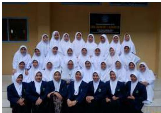
Gambar 4. Foto bersama guru TIK dan siswi SMA Ibrahimy 2 Sukorejo

Pelatihan ini berjalan dengan lancar dan memberikan dampak positif bagi siswi SMA Ibrahimy 2 Sukorejo, diharapkan kegiatan serupa dapat terus dikembangkan untuk mendukung literasi digital peserta didik.