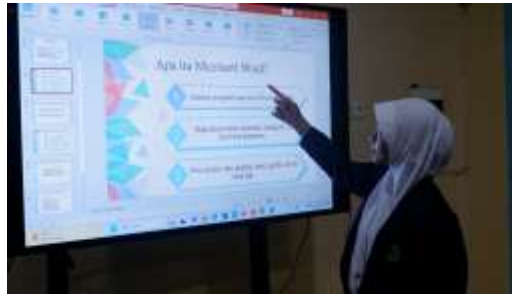
Gambar1. Penyampaian Materi I

Kegiatan selanjutnya melakukan pelatihan dalam menggunakan aplikasi Microsoft Word seperti cara mengetik, membuat paragraf, mengatur jarak antar baris, memasukkan gambar dan cara menyimpan dokumen yang sudah dibuat.