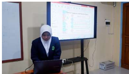
Gambar 2. Penyampaian materi II