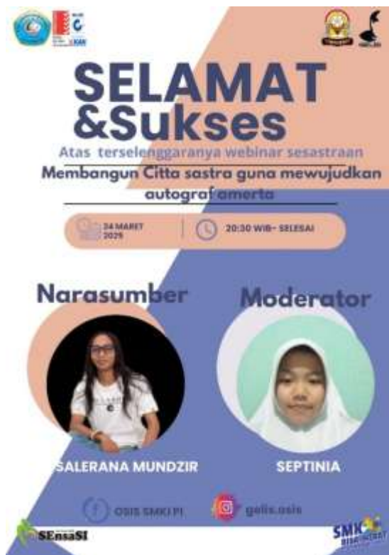
Gambar 3. Karya praktik peserta

Sesi terakhir yaitu sesi praktik yang dilaksanakan dikediaman masing-masing peserta. Pada sesi praktik peserta diminta membuat poster kegiatan dengan memanfaatkan template yang tersedia dalam aplikasi Canva. Peserta diberi waktu 1 jam setelah webinar berakhir dan peserta diminta mengumpulkan hasil editannya kepada tim pelaksana via whatsapp. Berikut salah satu karya dari peserta webinar