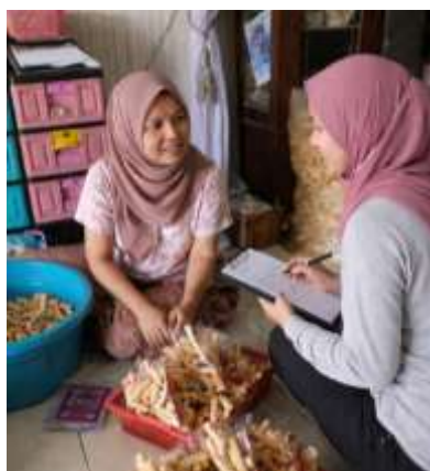
Gambar 1 survei dan observasi kepada pihak karyawan

Berdasarkan hasil pelaksanaan, terdapat beberapa capaian utama, yaitu peningkatan pemahaman mitra terkait pentingnya branding, terbentuknya konsep desain kemasan yang lebih menarik, serta tersusunnya storytelling produk yang mampu memperkuat identitas merek [14]. Kegiatan dilakukan dalam bentuk penyuluhan, pelatihan, dan pendampingan langsung yang melibatkan pemilik UMKM secara aktif. Dalam kegiatan melakukan survei dan observasi kepada pihak karyawan dengan melakukan pre test dapat dilihat pada Gambar 1 sebagai berikut.