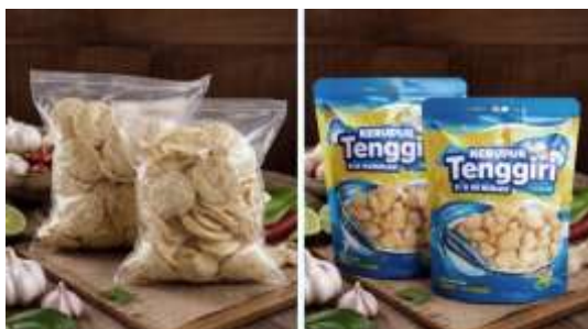
Gambar 2 Desain kemasan baru produk kerupuk ikan tenggiri

Namun demikian, meskipun terjadi peningkatan pemahaman, implementasi secara berkelanjutan masih memerlukan pendampingan lanjutan, terutama dalam konsistensi penggunaan identitas merek dan pemanfaatan media digital untuk pemasaran. Perubahan kemasan produk sebelum dan sesudah pendampingan dapat dilihat pada Gambar 2.