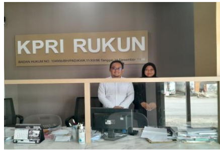
Gambar 2 Foto Dokumentasi