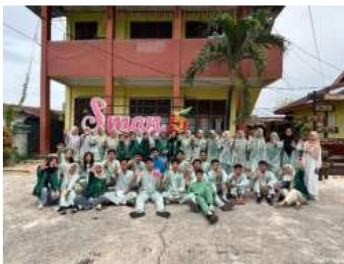
Gambar 2. Foto bersama siswa-siswi SMAN 5 Pekanbaru

Dari pemaparan yang telah disampaikan kasus kekerasan seksual ini perlu upaya penanganan dan pencegahan yang dilakukan. Orang tua dan guru memiliki peran yang sangat penting dalam menjaga anak dari segala bentuk kekerasan baik fisik maupun mental termasuk di dalamnya kekerasan seksual [6]. Adapun beberapa upaya pencegahan yang bisa dilakukan yakni dengan memberikan pemahaman kepada seluruh pihak di lingkungan sekolah mengenai informasi terkait kekerasan seksual, melalui sosialisasi yang diberikan kepada siswa-siswi seperti yang dilakukan oleh mahasiswa ini juga bisa menyampaikan upaya apa saja yang bisa dilakukan siswasiswi untuk menolak dengan keras kasus kekerasan seksual serta memberikan beberapa saran positif ke berbagai pihak di lingkungan sekolah [1].