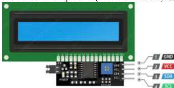
Gambar 3. LCD dengan I2C

LCD I2C adalah Modul LCD (Liquid Crystal Display) yang dikendalikan secara serial sinkron dengan menggunakan protokol I2C. Normalnya, Modul LCD dikendalikan secara paralel baik untuk jalur data maupun kontrolnya. LCD dapat menampilkan data baik dalam bentuk teks maupun angka yang sudah di program dari mikrokontroler. LCD 16x2 mampu menampilkan sebanyak 32 karakter yang terdiri dari 2 baris dan tiap baris dapat menampilkan 16 karakter. LCD I2C ini memiliki 4 kaki pin, yaitu GND atau Ground, pin VCC 5 Volt, pin kontrol SCL dan pin SDA (Deswar & Pradana, 2021).