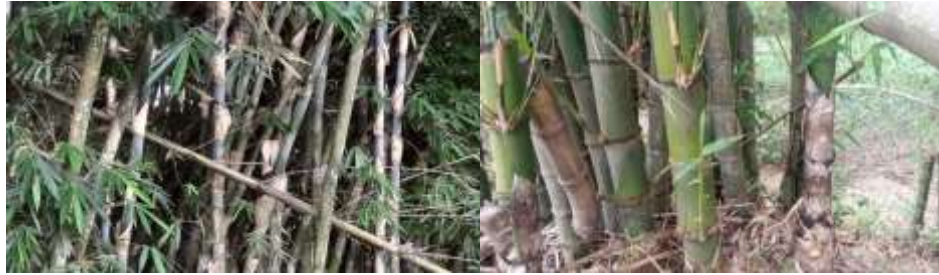
Gambar 3. Ciri Fisik Bambu Sampel Riset

Tanaman bambu apus dapat tumbuh merumpun atau berkelompok, tegak, dan rapat. Di bagian batangnya sering tertutup dengan bulu-bulu hitam atau coklat. Tanaman bambu ini bisa tumbuh tinggi mencapai 22 meter. Sedangkan batang bambu biasanya mempunyai diameter 4 hingga 15 cm dan panjang ruas bambu sekitar 20 hingga 60 cm. Pohon bambu ini umumnya tumbuh baik di wilayah dataran rendah yang lembap dan panas.