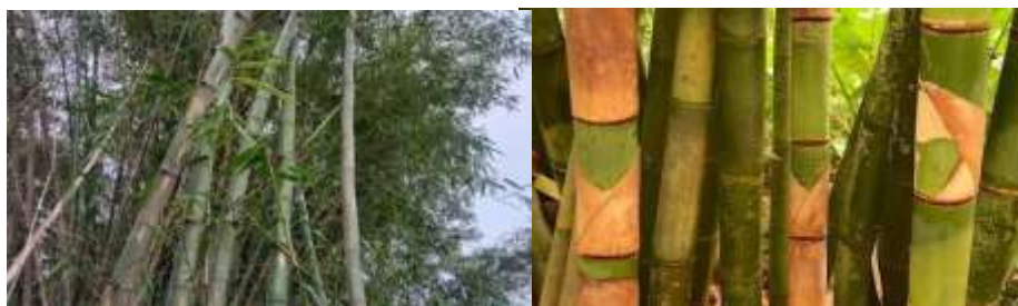
Gambar 2. Ciri Fisik Bambu Apus dari Literatur

Berdasarkan pengamatan dan studi literatur yang dilakukan dalam menentukan jenis bambu yang digunakan, maka dapat disimpulkan bahwa bambu yang dijadikan sampel pada ini merupakan jenis bambu tali atau bambu apus ( Gigantochloa apus ). Kesamaan sifat fisik dari bambu Apus dan bambu pada sampel dapat dilihat pada gambar dibawah ini.