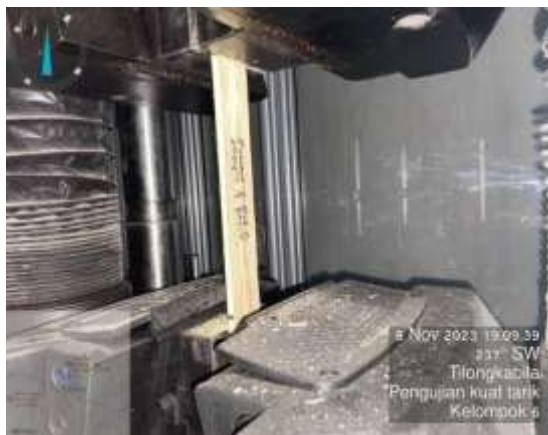
Gambar 1. Pengujian Kuat Tarik