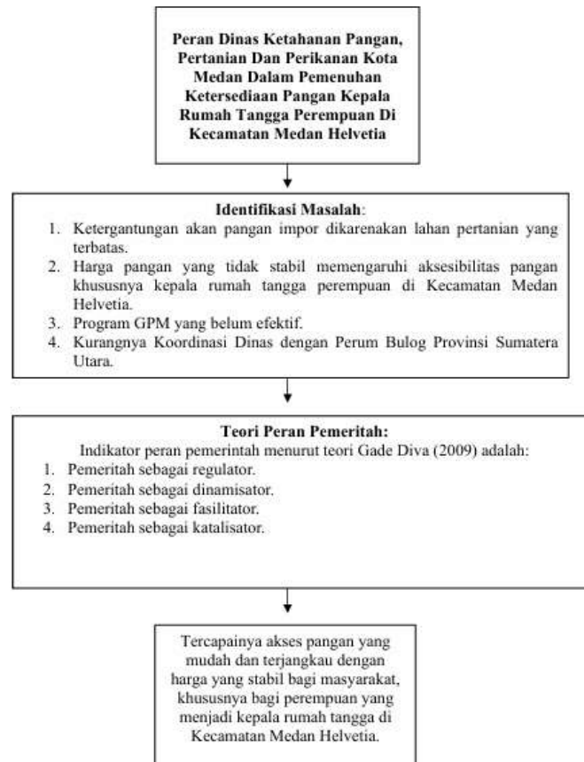
Gambar 3. Kerangka Berpikir