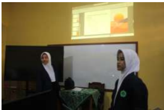
Gambar 4. Pemaparan materi tentang CorelDRAW