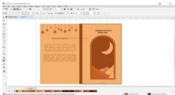
Gambar 1. Hasil Desain Cover buku

Hal ini dikarenakan para peserta mendapatkan wawasan baru mengenai tahapan ataupun proses kreatif perancangan suatu karya desain grafis yang dimulai dari konsep sampai ke final desain yang sesuai dengan prinsip-prinsip desain grafis. Kegiatan pelatihan desain grafis ini begitu membantu para siswi SMK IBRAHIMY 1 sukorejo karena, kompetensi yang diperoleh sangatlah berguna bagi bekal para siswi saat terjun ke dunia kerja. Selanjutnya pada gambar dibawah ini yaitu teknik pembuatan cover buku menggunakan aplikasi CorelDRAW dengan hasil yang maksimal.