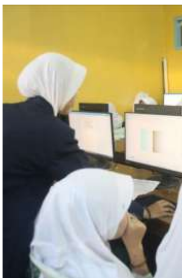
Gambar 5. Praktek desain CorelDRAW