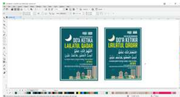
Gambar 2. Hasil Desain poster