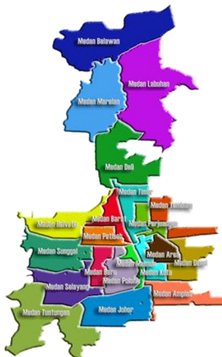
Gambar 3. Peta Pembagian Kecamatan di Kota Medan