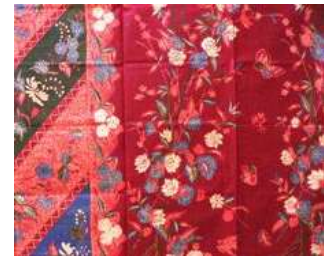
Gambar 3. Motif bunga plum dalam tekstil bermotif sebagai simbol keteguhan, harapan, dan ketahanan menghadapi musim dingin dalam budaya Tionghoa