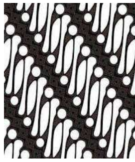
Gambar 5. Motif Parang sebagai simbol keteguhan, terus-menerus, dan kekuatan spiritual dalam batik Jawa