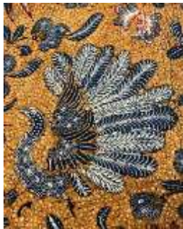
Gambar 1. Motif burung phoenix dalam tekstil bermotif sebagai simbol kebangkitan, keharmonisan, dan keabadian dalam budaya Tionghoa