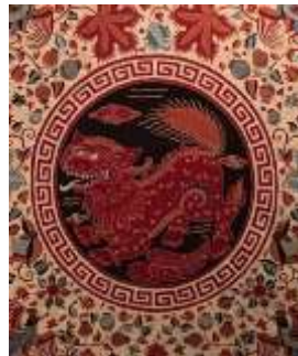
Gambar 2. Motif naga dalam batik peranakan sebagai simbol kekuasaan, keberuntungan, dan pengaruh budaya Tionghoa