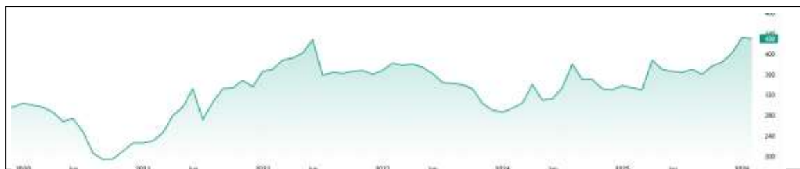
Gambar 1. Tren Harga Saham PT Asuransi Multi Artha Guna Tbk. 2020-2025

PT. Asuransi Multi Artha Guna Tbk adalah perusahaan asuransi umum di Indonesia dengan pengalaman operasional lebih dari 44 tahun. Komposisi kepemilikan sahamnya sejak 2016 didominasi oleh Fairfax Asia Limited (80%), diikuti PT. Bank Pan Indonesia Tbk (7,76%), dan sisanya oleh masyarakat. Adapun fluktuasi harga saham perusahaan sepanjang 2020-2024 dapat diamati pada Gambar 1.